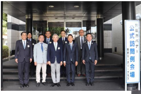
矢坂ガバナー御一行をお迎えして